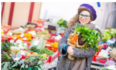
Le marché de la Place de la Découverte